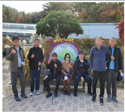
다솜힐링캠프 (화요미식회 - 제주도, 바다향기수목원)