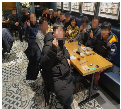
2022 하반기 가족교육 및 다솜 송년회