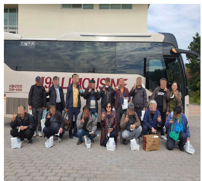
천리포 수목원 연합캠프 (다솜&하늘소)