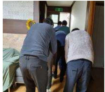
소방교육 및 훈련