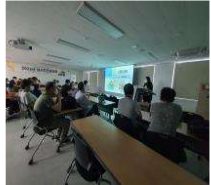
교육(건강, 성, 인권, 안전, 직업)