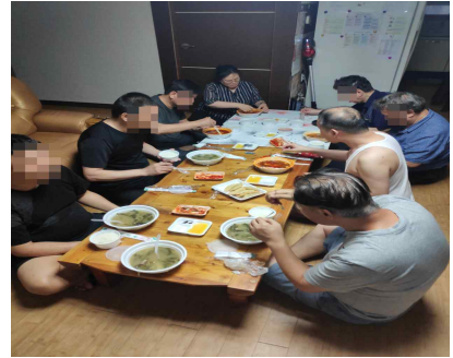
송별회 및 생일파티