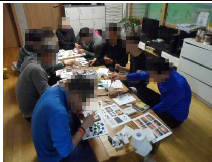
'세상을, 미래를 그리다' 미술치료시간