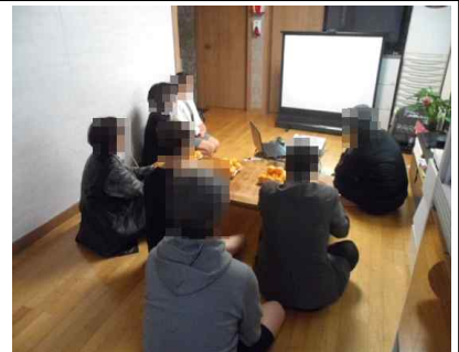
개인정보 및 성교육