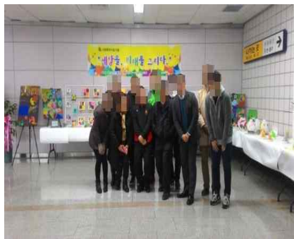
'세상을, 미래를 그리다' 전시회