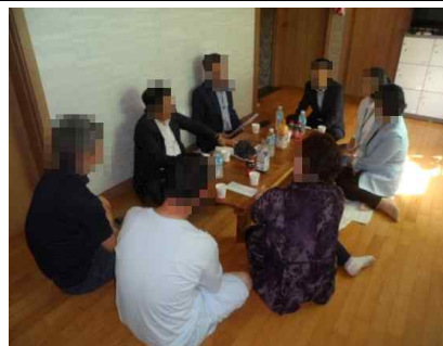
이성 구청장님 방문