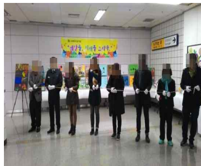
'세상을, 미래를 그리다' 전시회